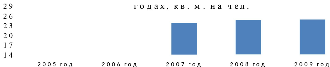
Рисунок 2. Обеспеченность населения Кадыйского муниципального района Костромской области жильем в 2007-2009 годах, кв. м. на чел.

На территории Кадыйского района преобладает малоэтажное индивидуальное жилищное строительство. Динамика изменения обеспеченности жильем населения Кадыйского муниципального района Костромской области в период 2005-2009 годов представлена на рисунке 2 .