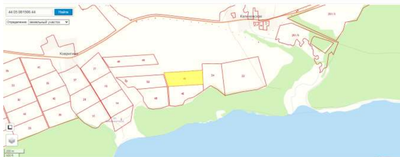
Публичная кадастровая карта: Костромская область

Приложение – схема с характеристиками земельного участка с публичной кадастровой карты либо иные картографические материалы.